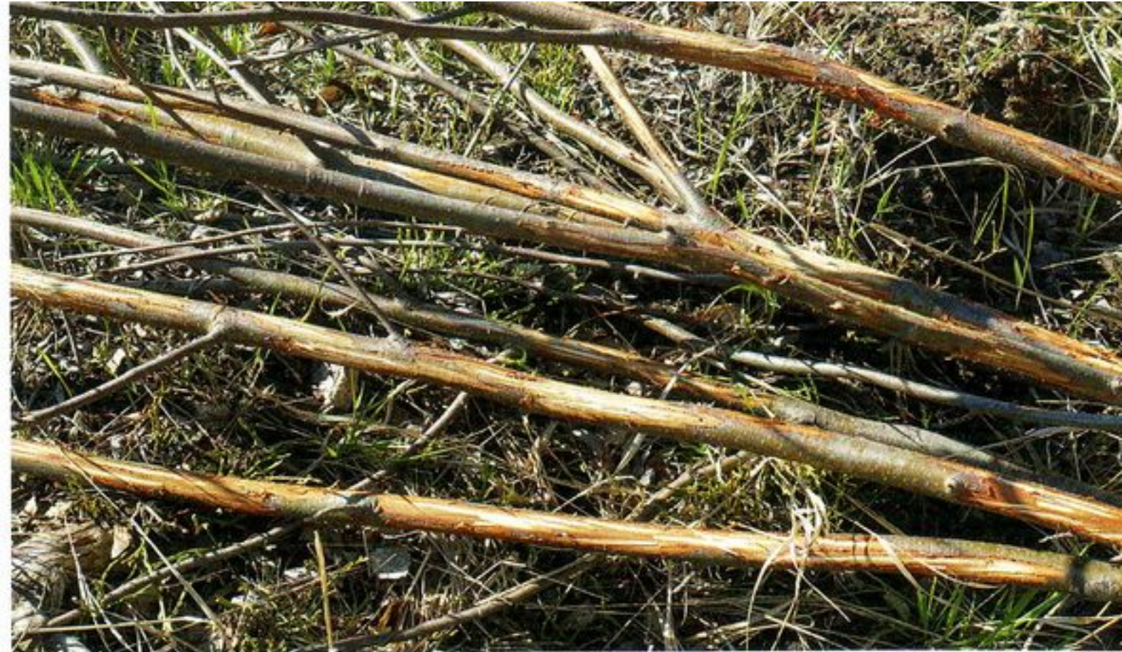
Na čerstvo spílených ohryzových drevinách (v tomto prípade jarabina vtáčia) nachádza jelenia zver významný a ľahko dostupný potravinový zdroj. Zver na nich odhrýza kôru nie len na kmeni, ale aj na konároch.

Zároveň chceme ilustrovať, že rôzne dreviny majú ako zdroj potravy pre lesnú zver nielen rôzne kvalita-