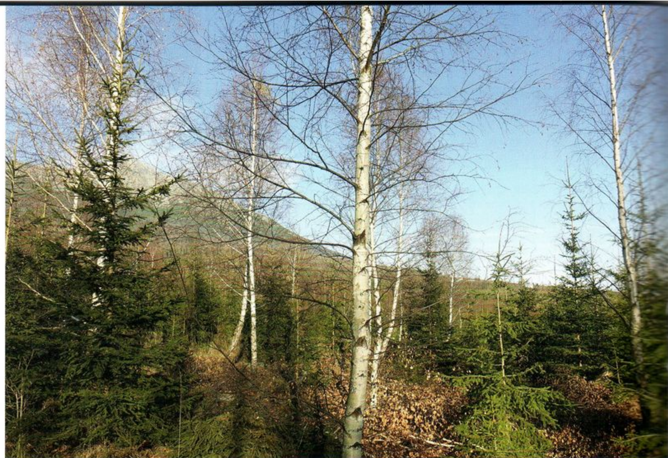
Breza vďaka dobrým zmladzovacím schopnostiam a rýchlemu výškovému rastu predbieha ostatné dreviny, a to najmä v prípade prirodzenej obnovy na pokalamitných plochách. Príklad z Vysokých Tatier – situácia v roku 2018.

Pionierske dreviny by sa mali využívať na odlákavie lesnej zveri od cieľových drevín ich ponechaním ako prímiesi v porastoch rôzneho veku (teda ich nikdy neodstraňovať totálne), prípadne zriaďovaním či podporou skupín týchto drevín – tzn. vo forme ohryzových plôch. V prípade ponechávania týchto drevín ako prímiesi treba uprednostňovať ich skupinky pred